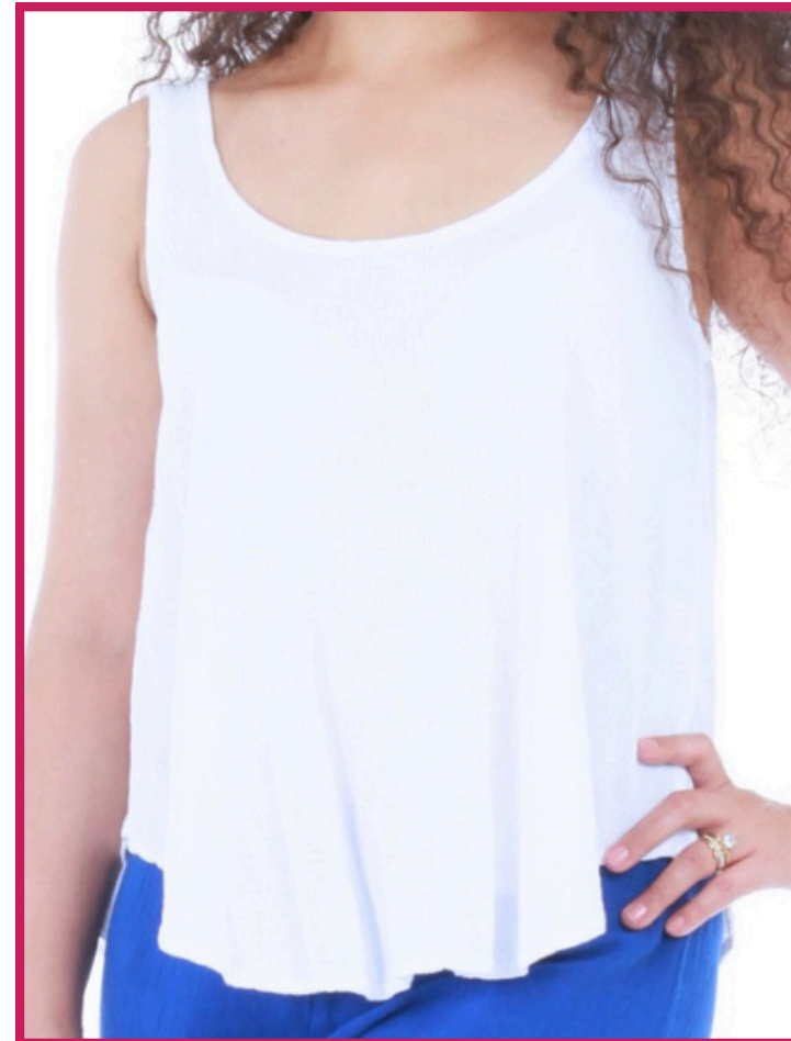
Modelo/Model: Ajijic Código/Code: 1301