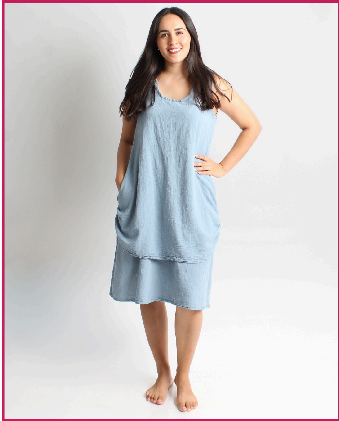
Modelo/Model: Miranda Código/Code: 3502