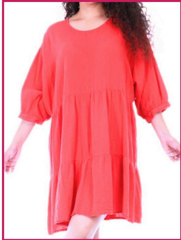
Modelo/Model: Superior Código/Code: 3106