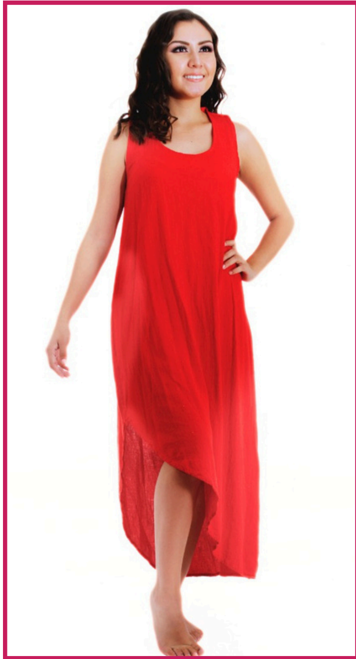
Modelo/Model: Santa Lucía Código/Code: 3006