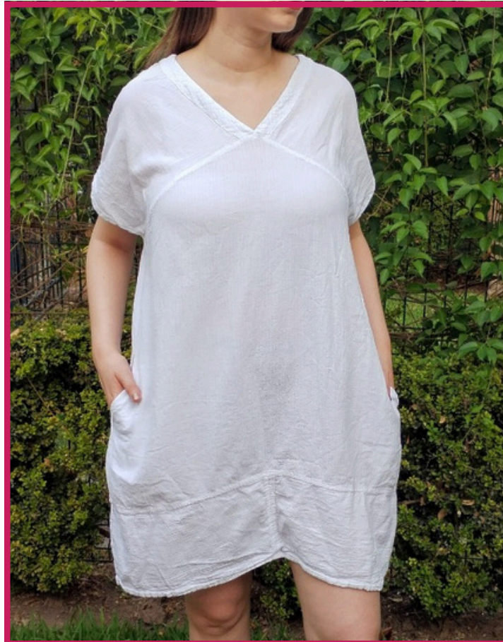
Modelo/Model: Encino Código/Code: 3407