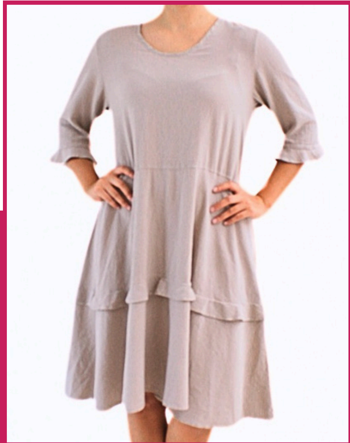
Modelo/Model: Volga Código/Code: 3202