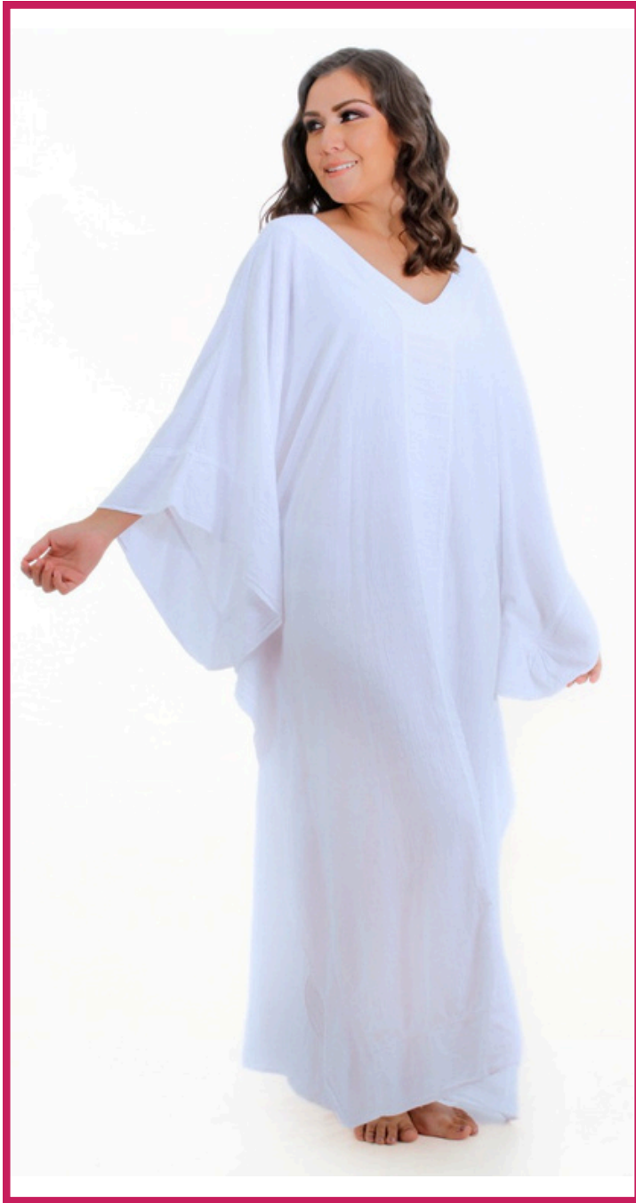
Modelo/Model: Ónix Código/Code: 2901