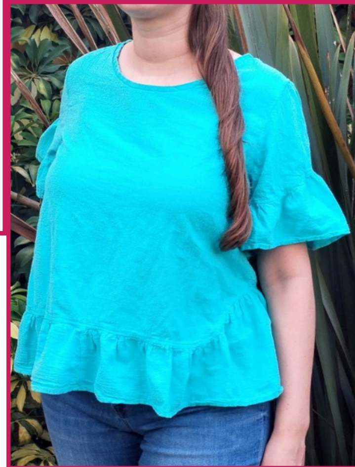
Modelo/Model: Jacaranda Código/Code: 1404