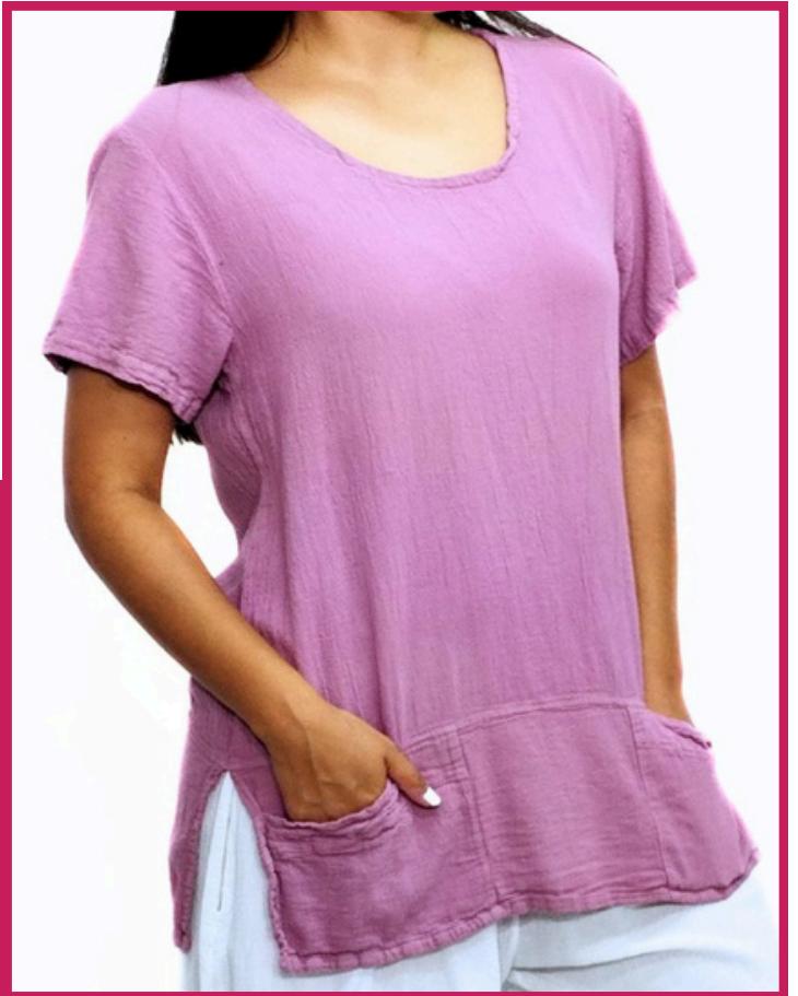
Modelo/Model: Rubí Código/Code: 1716