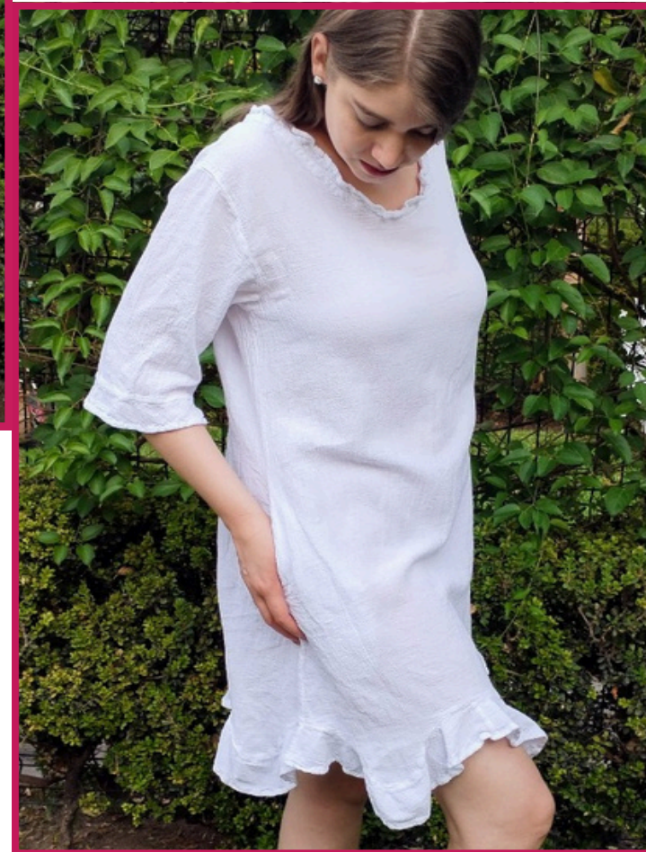
Modelo/Model: Olivo Código/Code: 3406