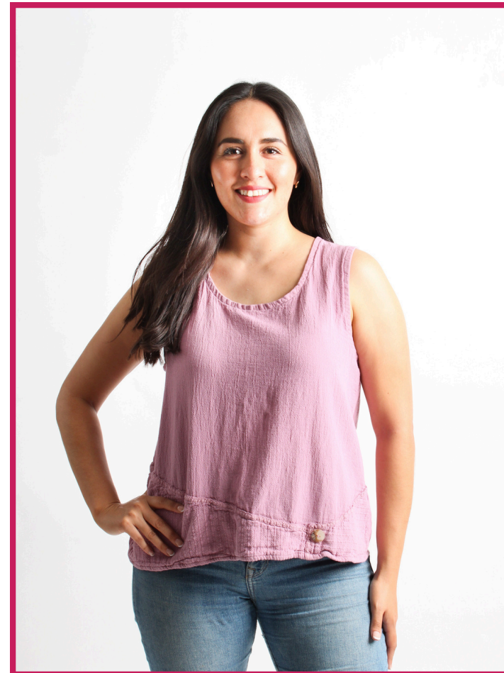
Modelo/Model: Ebony Código/Code: 1501