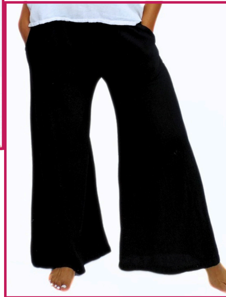
Modelo/Model: Angie Código/Code: 6303