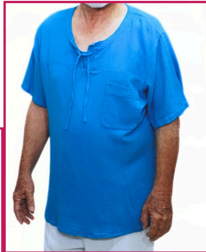
Modelo/Model: Pánuco Código/Code: 1204