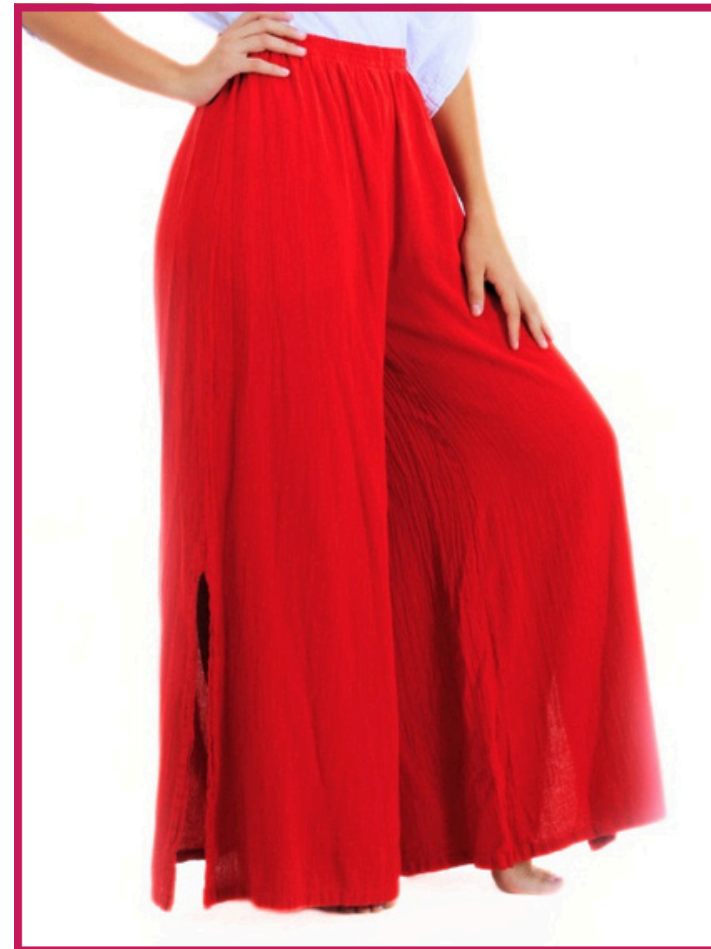
Modelo/Model: Jamaica Código/Code: 6008