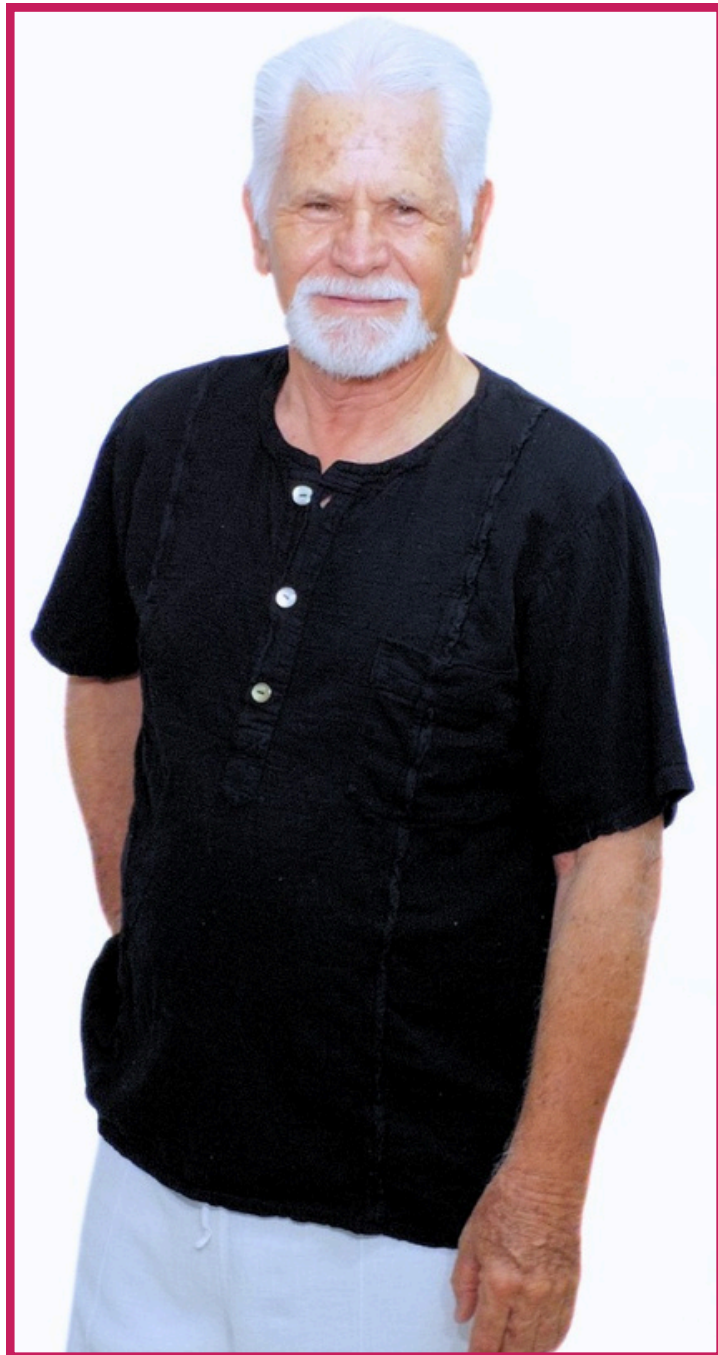
Modelo/Model: Creel Código/Code: 1307