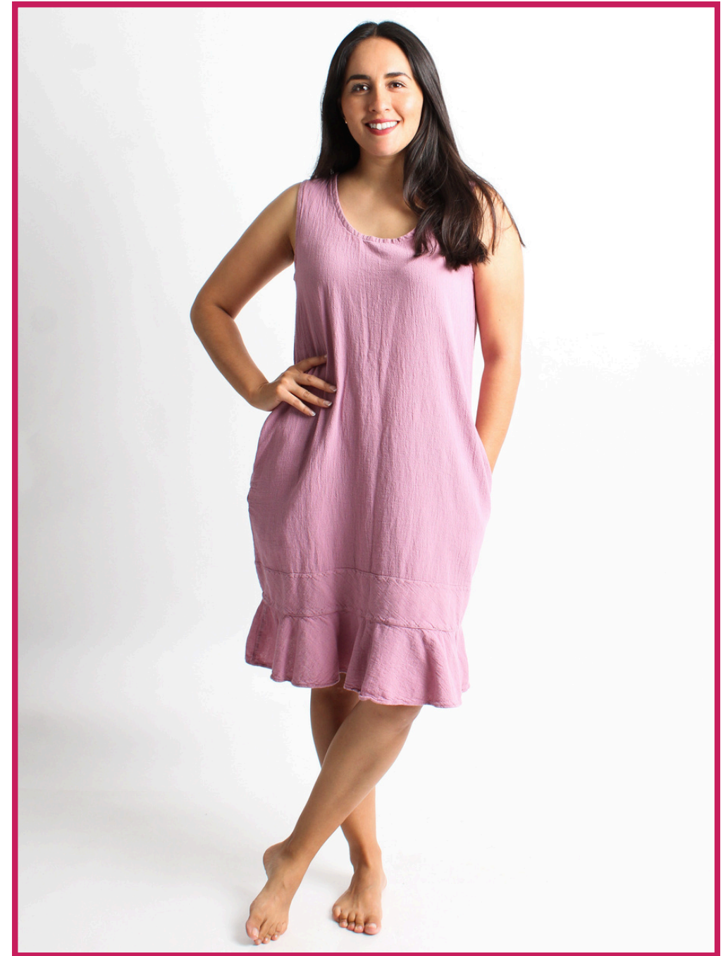
Modelo/Model: Matucana Código/Code: 3501