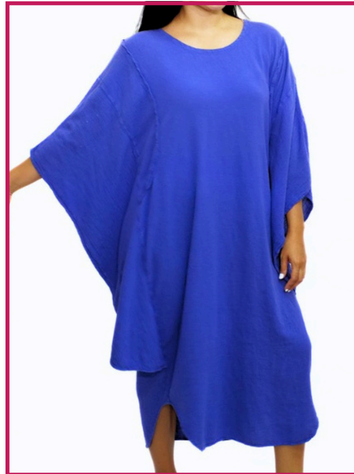
Modelo/Model: Santiago Código/Code: 2201