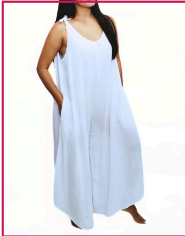
Modelo/Model: Hurón Código/Code: 6101