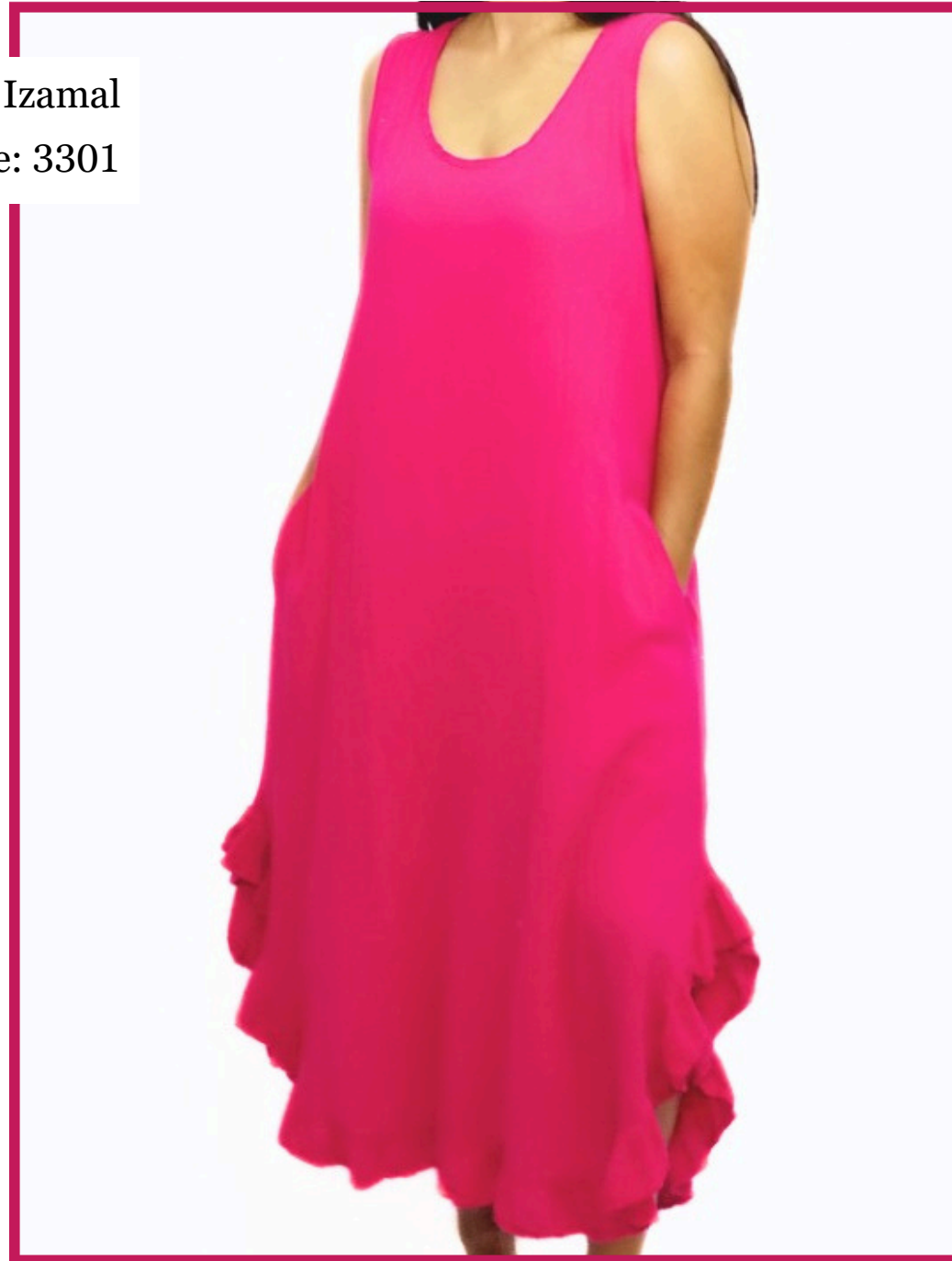
Modelo/Model: Izamal Código/Code: 3301