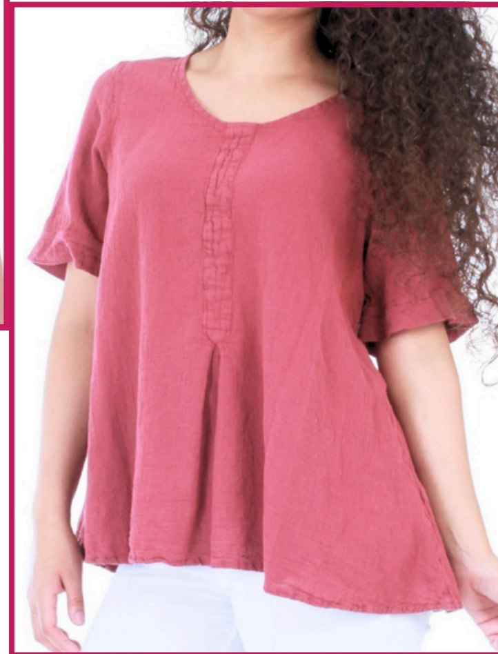
Modelo/Model: Cuitzeo Código/Code: 1104