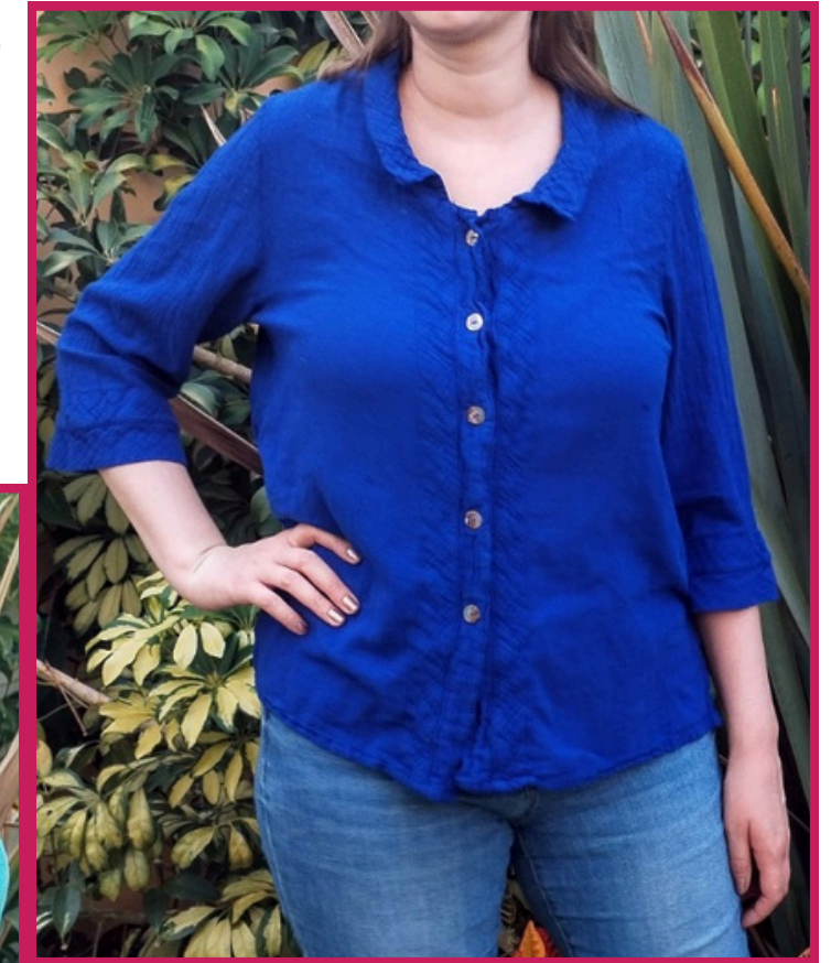
Modelo/Model: Ceiba Código/Code: 1401