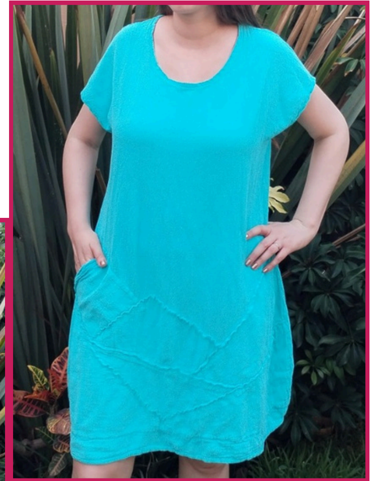
Modelo/Model: Sauce Código/Code: 3403