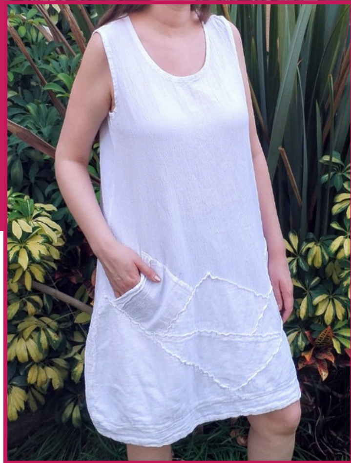
Modelo/Model: Fresno Código/Code: 3401