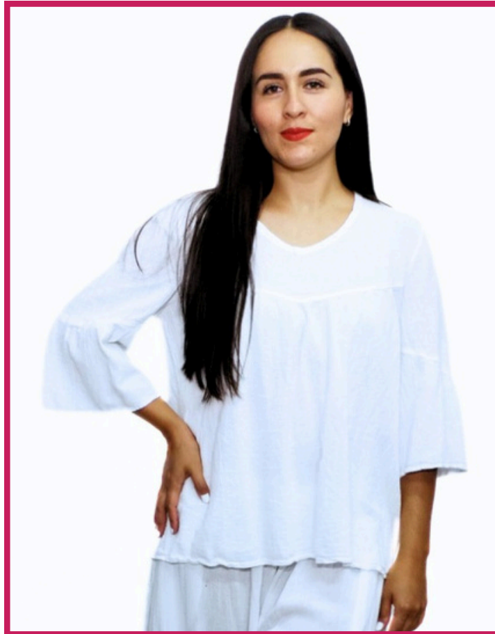
Modelo/Model: Cholula Código/Code: 1303